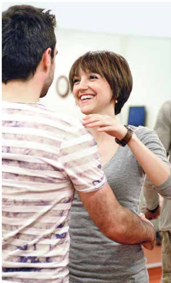
Bewundernde Blicke ernten: «Klassischer Hochzeitstanz», 4 Lektionen.

Trauringe selber schmieden: «Schmuck gestalten und Goldschmieden», 30 Lektionen.