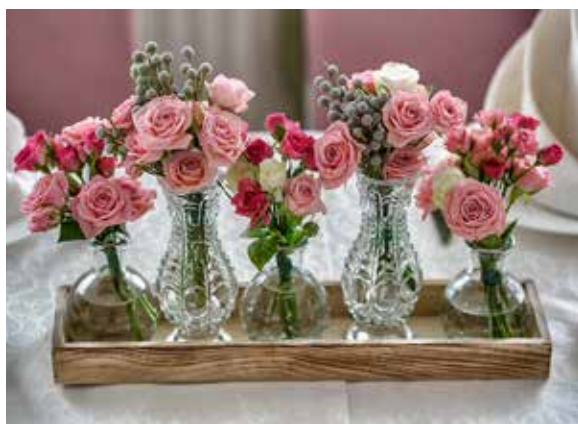
Mit der Tischdekoration punkten: «Trendfloristik – Frühlingshafte Gefässfüllung», 3 Lektionen.

Kreative Einladungen: «Karten für jede Gelegenheit», 5 Lektionen.